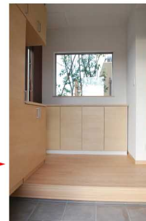
ドアを開けると正面の窓から緑の借景が迎えてくれる玄関ホール。窓下の壁面を活かした収納棚は、靴類や傘等小物が多い玄関をスッキリとしてくれます。