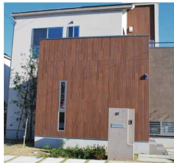
個性的で美しい外観を演出しているサイディングボードの壁。