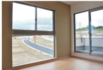
コーナーをはさんで大きな2面採光の窓が、明るい主寝室をつくれます。