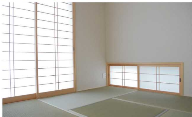
内障子と地窓が光を和らげ、落ち着いた和の雰囲気をかもしだします。