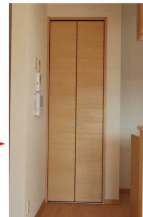
キッチンには収納スペースが多い方がうれしい。客用の食器入れに、また食品庫に。