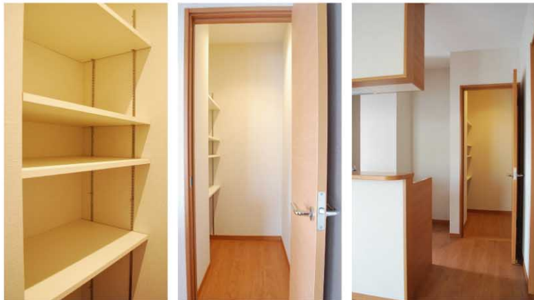
キッチン横の納戸スペース。食品庫として、また客用の食器棚としても十分な広さを確保しています。