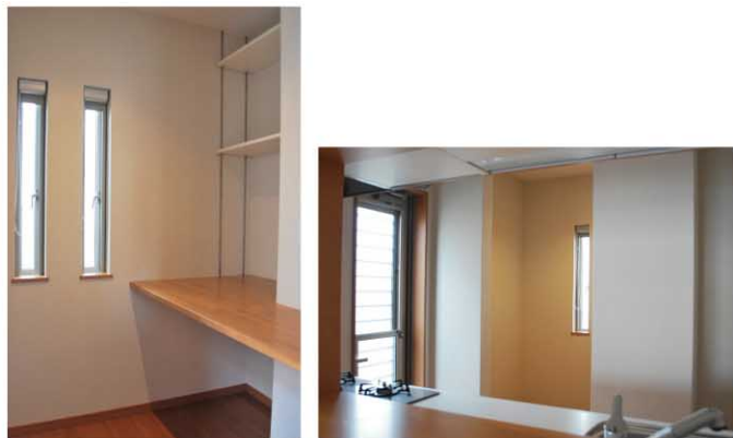
キッチン横のミセスコーナー。目が離せない煮物をしながら手芸などの趣味が楽しめるスペースです。