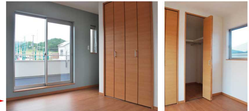
「ウォークインクローゼット」のある主寝室。バルコニーサイドの壁の淡緑のポイントカラーが、落ち着いた雰囲気をつくりだしています。