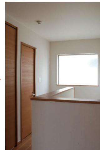
腰窓で明るい階段。