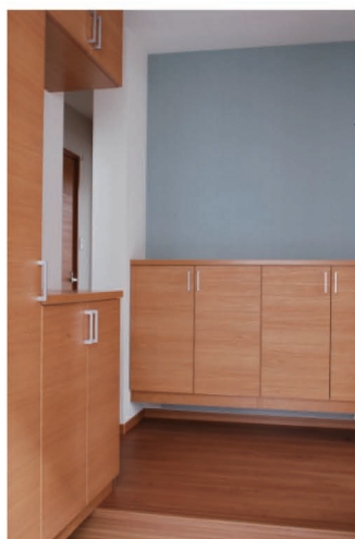
玄関ホールの収納スペースは、傘や靴が収められる便利スペースで、玄関もスッキリ。