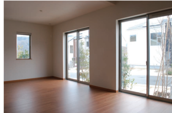
2ヶ所の掃き出し窓に加え、明り取りと借景を兼ねた腰窓のある開放感のあるLD。