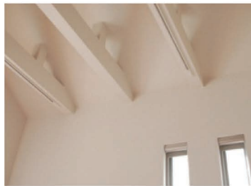
リビング側の吹抜け天井は「梁出し仕上げ」で、照明用のライティングレールを設けています。壁面のスリット窓など趣のあるリビングライフをお楽しみいただける設えです。