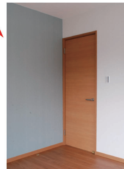
空間に変化を演出するポイントクロス。