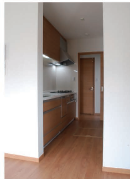
家事動線が合理的で使いやすい 2ウェイキッチン。

土地面積 175.36㎡ (約54.25坪) 延床面積 97.30㎡ (約29.43坪) 1 階床面積 55.48㎡ (約16.78坪) 2 階床面積 41.82㎡ (約12.65坪)